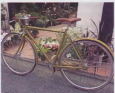
「これはFIG BIKEという、原宿と代官山にある自転車専門ショップにて購入しました。」

に自転車に乗ってが増え、運動にもと思購入。気候と、とにかく気持ち。自転車仲間としたり知らない道けたり、乗ると新しい! 楽しい!